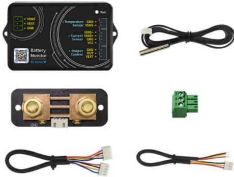
Référence I INDKL140F

Indicateur de capacité (coulombmètre) conçue pour mesurer divers paramètres tels que la tension, le courant, la puissance, la capacité de charge et décharge, les wattheures et le temps.